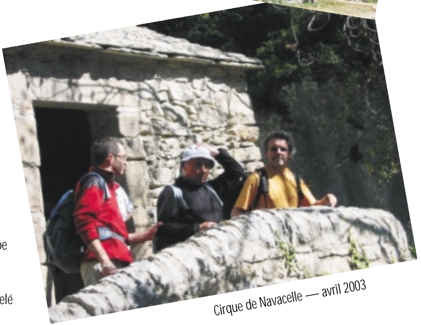
Cirque de Navacelle — avril 2003