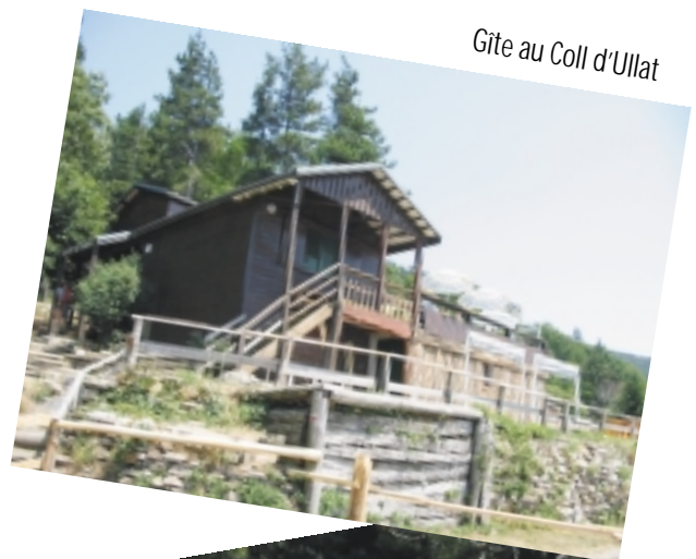
Gîte au Coll d'Ullat