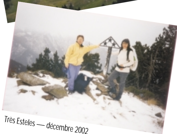
Très Esteles — décembre 2002