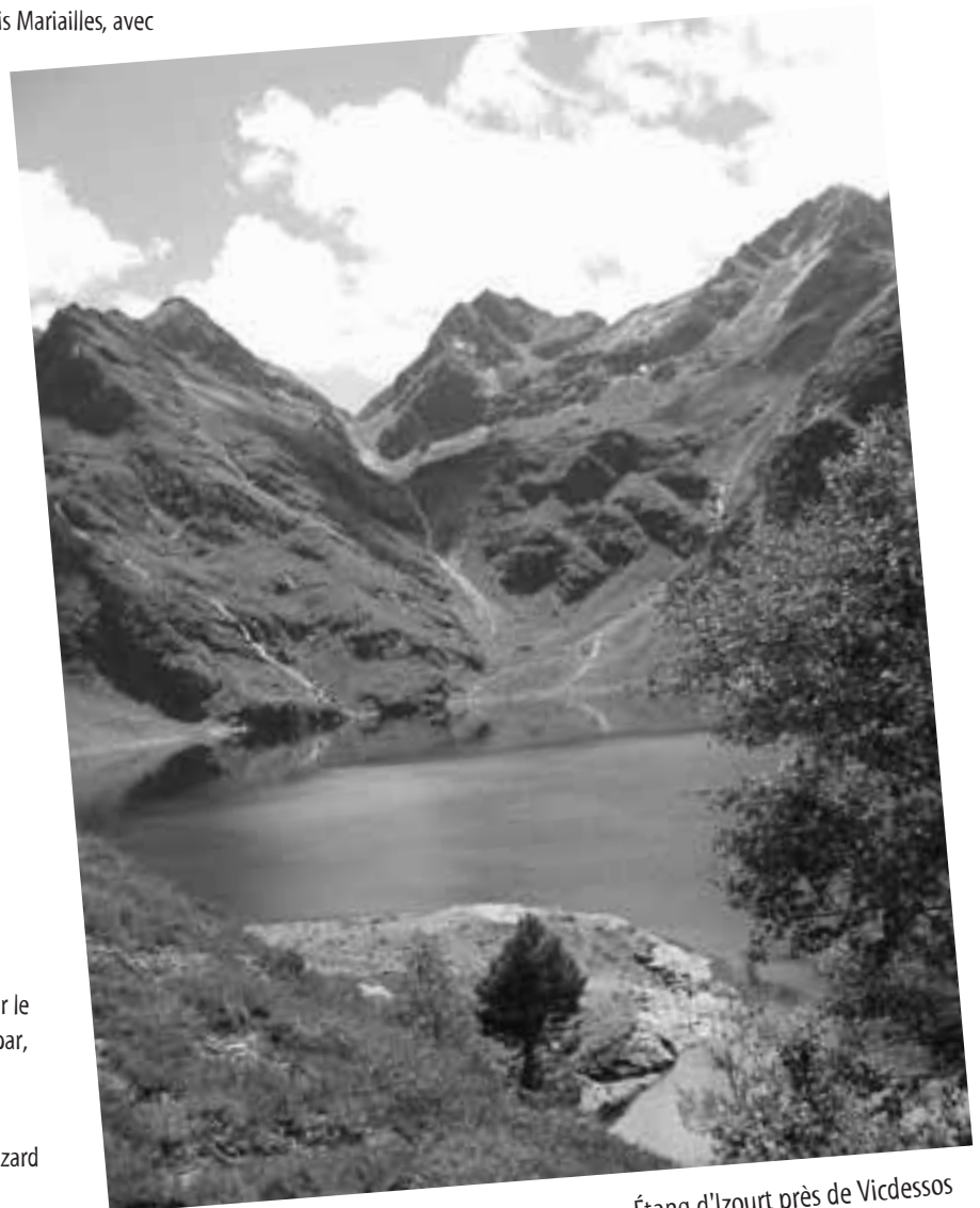
Étang d'Izourt près de Vicdessos