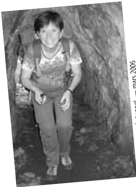
Pic de Saillfort par le tunnel — mars 2006